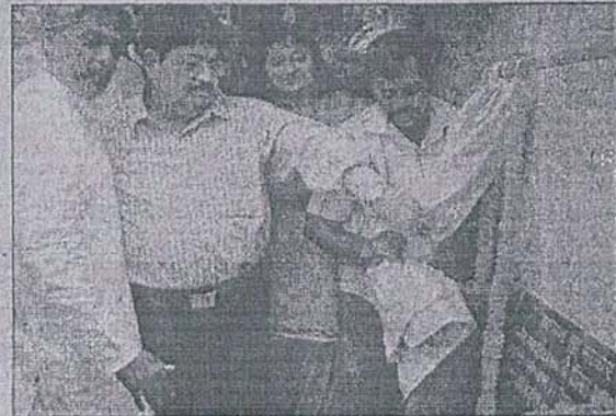
उद्घाटन करते नथवाणी।