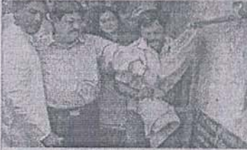
शिलान्यास करते नथवाणी.